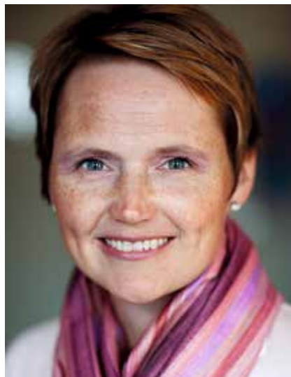
Anna-Karin Hatt, it- och energiminister, inviger Framtidens lärande.