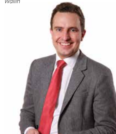
Tomas Tobé, ordförande i riksdagens utbildningsutskott.