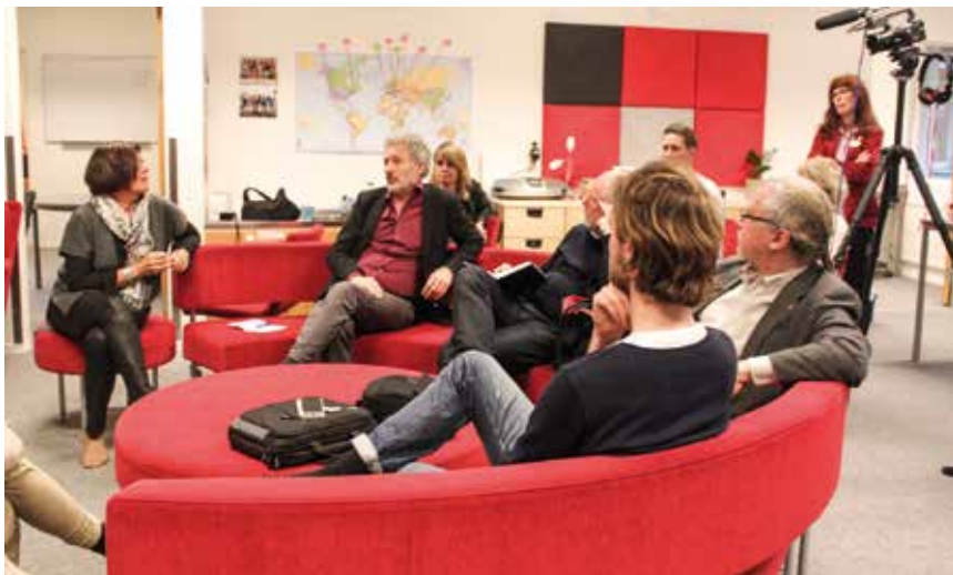
När juryn för Guldtrappan besökte Falkenberg tillbringades delar av dagen på Ljungbyskolan i en av de utvecklande lärmiljöer som Falkenberg satsar på.