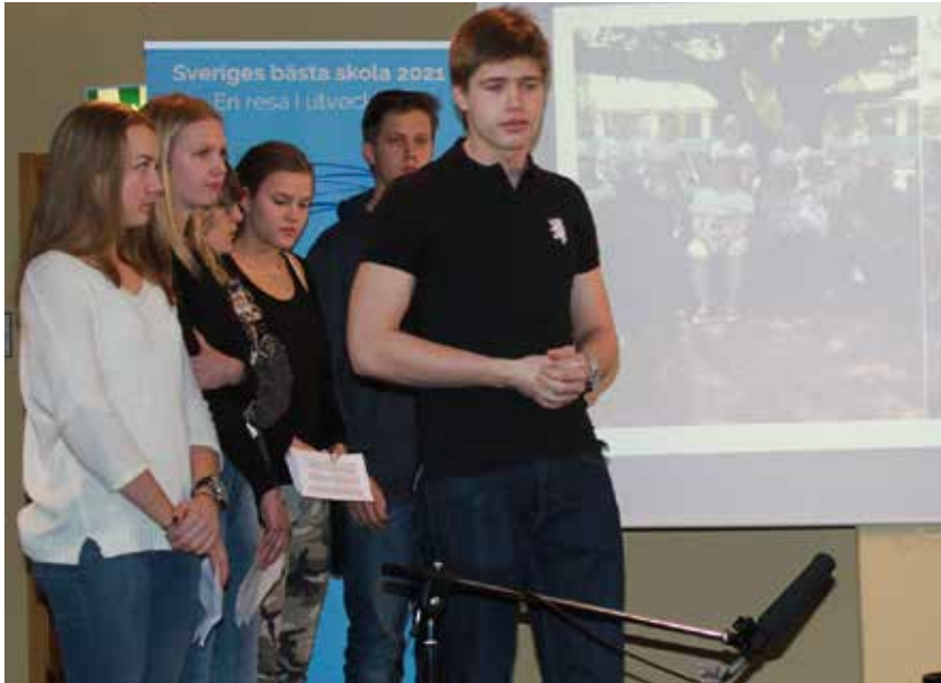
Eleverna från årskurs 2 på gymnasiet i Sundsvall presenterar det arbete de gör i kursen "Youth in Action", där de på olika sätt hjälper en by i Zanzibar under kursens gång.