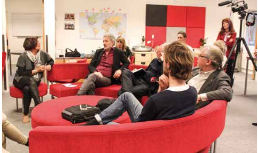
När juryn för Guldtrappan besökte Falkenberg tillbringades delar av dagen på Ljungbyskolan i en av de utvecklande lärmiljöer som Falkenberg satsar på.